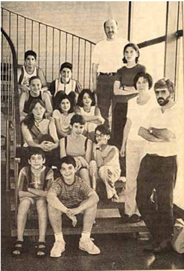
Imatge les primeres generacions d'alumnes i professors de l'Institut.