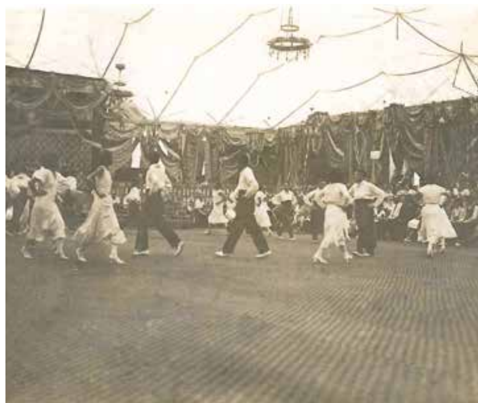
Un dels moments de la 'becerrada' de 1943 que es va celebrar en una plaça que es va instal·lar al final del carrer Puigvert. Al costat, el ball d'envelat a principis del segle passat.