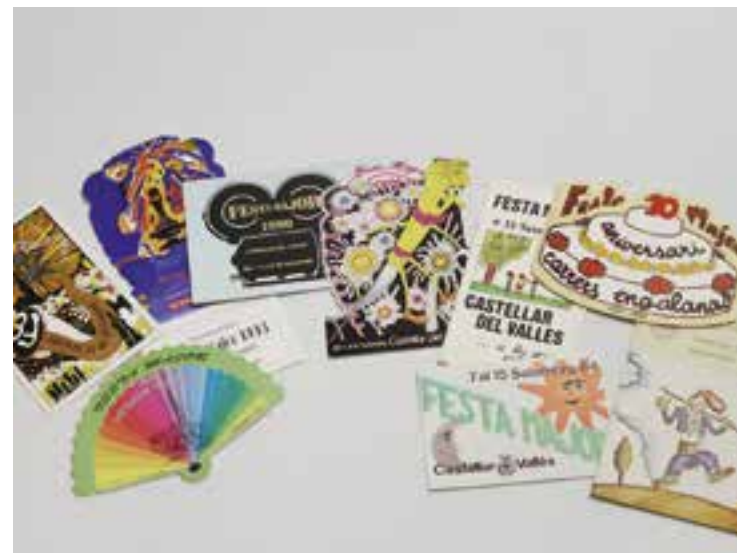
Programes de festes majors de diferents èpoques de Castellar del Vallès on es pot veure l'evolució del grafisme. || C. LECEGUI