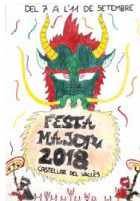
Nens del casal d'estiu, escola el Casal