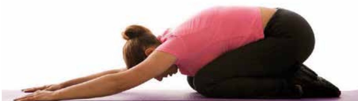
Es recomana portar tovallola, màrfega o estora a les sessions de ioga de la terrassa d'El Mirador.