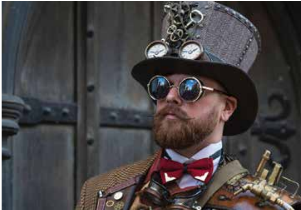
Actors disfressats amb la moda Steampunk es passejaran per la fira.

Diumenge 9 de 10.30 a 21 h Street Market 1900 c. Major, c. Sala Boadella, c. Hospital i c. Montcada