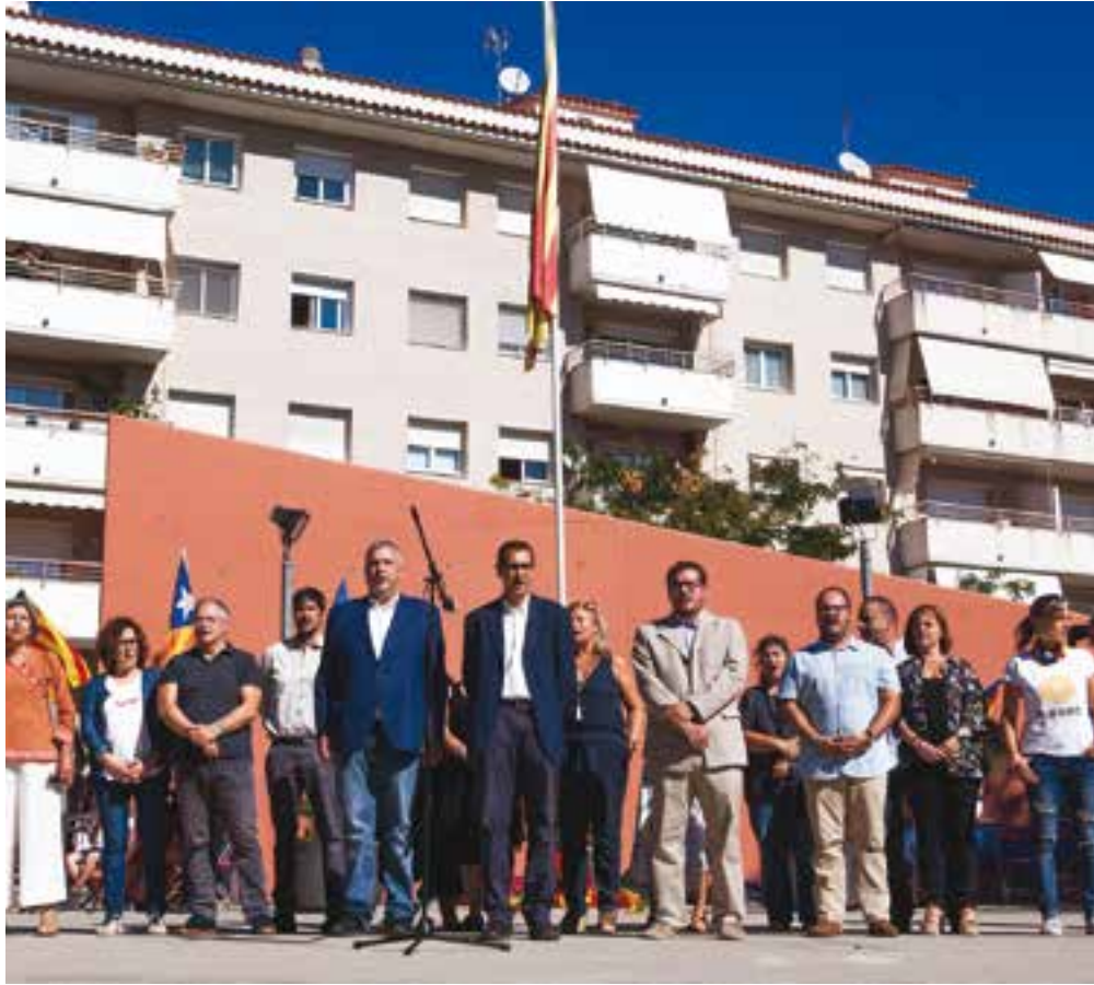
Els representants polítics locals cantant 'Els Segadors' a la plaça Catalunya, l'any passat.

La JOCVA interpretarà per segon any 'El cant dels segadors' després del manifest de l'11 de setembre