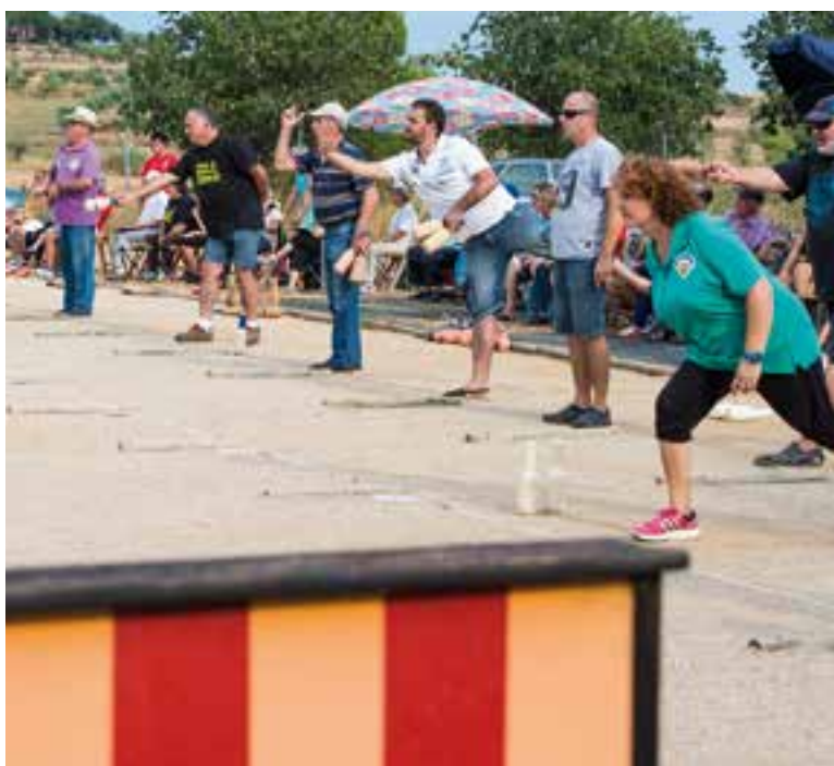
CB Colobres i CB Castellar organitzen dos torneigs de bitlles a les pistes. || A.S.A.

No desvetllem res de nou si afirmem que la pràctica de l'esport a la vila de Castellar se situa entre les més altes de ciutats de la mateixa mida. L'aposta per l'esport de qualitat de banda d'entitats i clubs ha garantit una varietat poques vegades vista en una localitat on poques disciplines es troben a faltar. Castellar és i seguirà sent un referent en l'esport amateur -també en el professional amb diversos atletes d'elit competint pel món- per a totes les viles dels voltants, que sovint s'emmirallen per tenir de referent quant a instal·lacions esportives i gestió. La Festa Major és el millor exemple per veure com l'esport és un dels principals eixos vertebradors dels actes a celebrar.