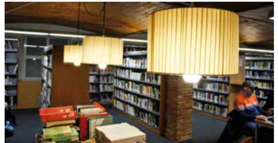
Una imatge de l'interior de la biblioteca.

L'Ajuntament va obrir fa alguns dies les inscripcions a l'Escape Room de Festa Major. Les sol·licituds per prendre part d'aquesta activitat, que compta amb un total de 432 places disponibles, es poden fer fins al proper divendres 7 de setembre fen us del formulari web www.castellarvalles.cat/escaperoom . Si no s'han exhaurit les places també es podran fer inscripcions presencialment a la Biblioteca Antoni Tort, al carrer de Sala Boadella, 6, els dies en què es durà a terme l'activitat. La participació a l'Escape Room de Festa Major es podrà fer en dos grups simultanis de 8 a 12 persones distribuïts al llarg dels dos dies en 11 sessions: 10 h, 11.20 h, 12.40 h, 14 h, 17 h, 19.20 h, 20.40 h, 22 h i 23.20 h. Per iniciar cada torn d'activitat caldrà un mínim de 8 persones i màxima puntualitat. En cas contrari, la reserva quedarà anul·lada. L'activitat està recomanada per a persones a partir de 8 anys (caldrà que els menors de 16 anys hi participin acompanyats d'un adult). Per als menors de 8 anys no caldrà inscripció sinó que podran accedir a l'activitat sempre que ho facin acompanyats del pare, mare o tutor/a legal.