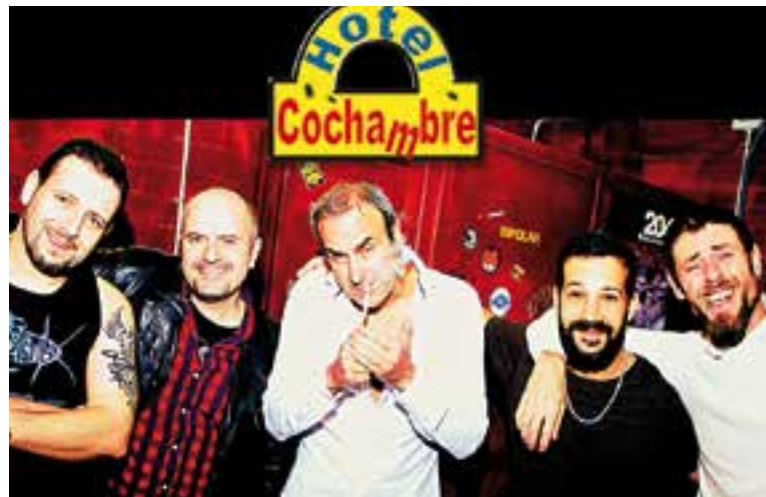
Hotel Cochambre es va crear l'any 2000.

Tenim un públic molt bèstia i molt meravellós. Vénen amb les samar-