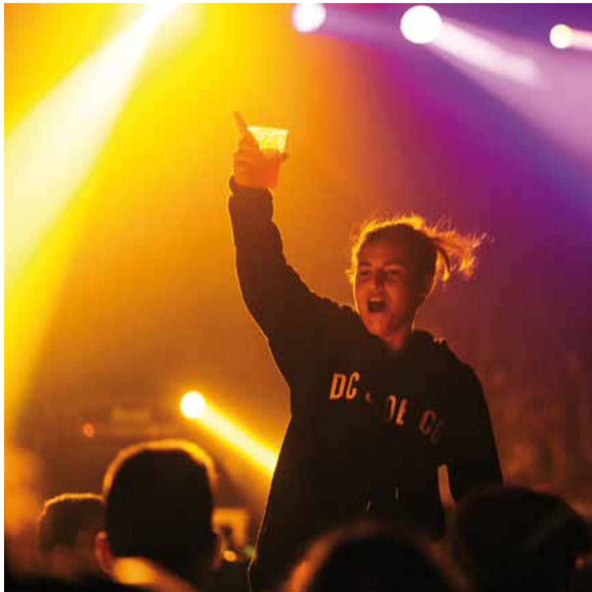
Un moment de Vilabarrakes de la Festa Major de 2017.

Enguany a més, s'instal·larà un Punt Lila per gaudir d'una Festa Major lliure d'agressions sexuals. Aquest punt estarà ubicat a l'espai Vilabarrakes, entre divendres 7 i dilluns 10. També n'hi haurà un altre de mòbil que funcionarà durant tot el Correlokals, el divendres 7 de setembre.