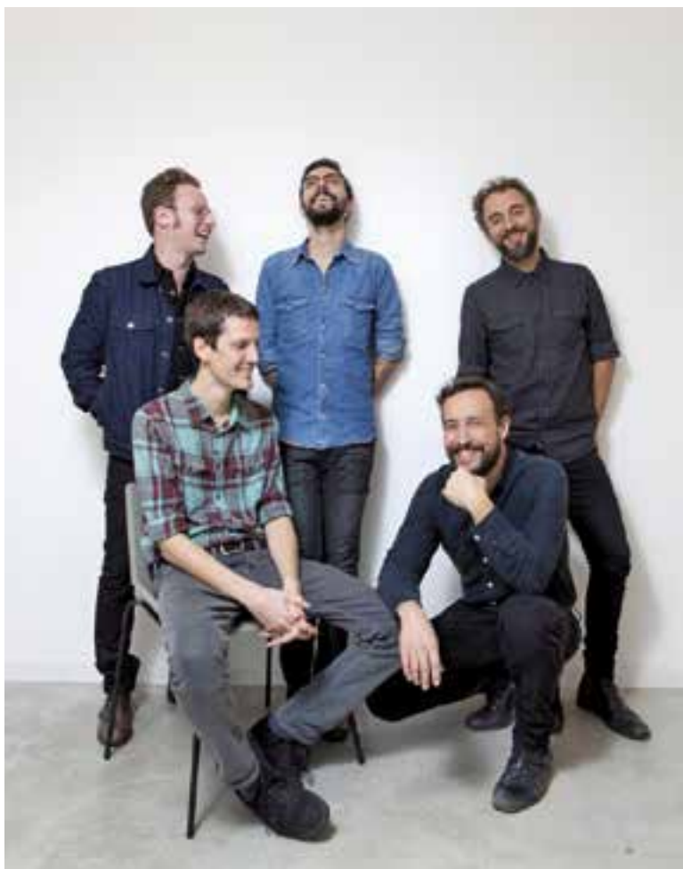
Imatge promocional del grup Mishima.

Dissabte 8, 22.30 h Mishima en concert Presentació del disc 'Ara i res' plaça d'El Mirador