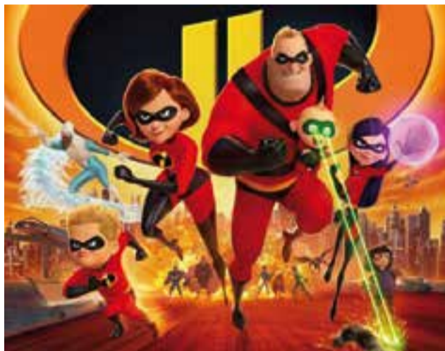
'Los increíbles 2', a l'Auditori Municipal, diumenge.

La propera projecció de cinema familiar a l'Auditori Municipal Miquel Pont serà aquest proper diumenge 21, amb la pel·lícula Els increïbles 2 . Es faran dues projeccions, una a les 12 hores, i l'altra, a les 16.30 h. És un film dirigit per Brad Bird amb Animation, d'aquest mateix any 2018. És una seqüela de la pel·lícula de super herois Els increïbles . + || M. A.