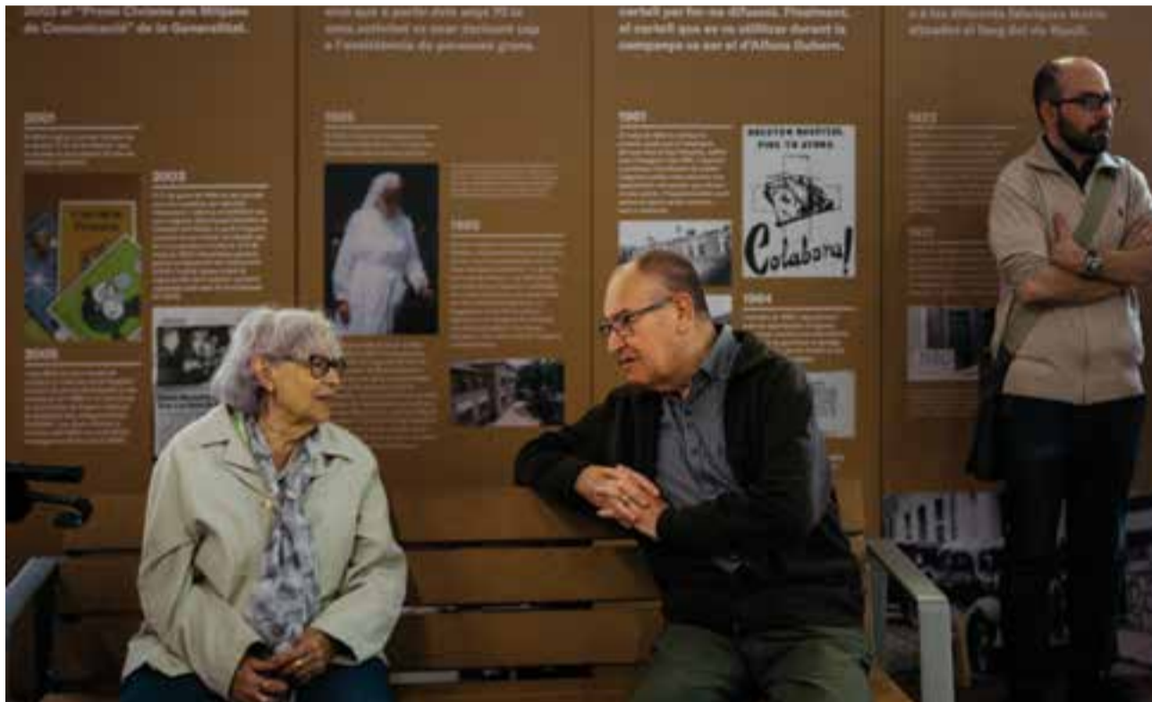
Persones que han format part de l'OSB al llarg de la seva història van ser presents a la inauguració de l'exposició.

El mercat municipal acull l'exposició dels 90 anys de l'Obra Social Benèfica