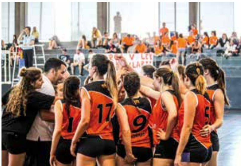
Les integrants del sènior femení, en una imatge d'arxiu.