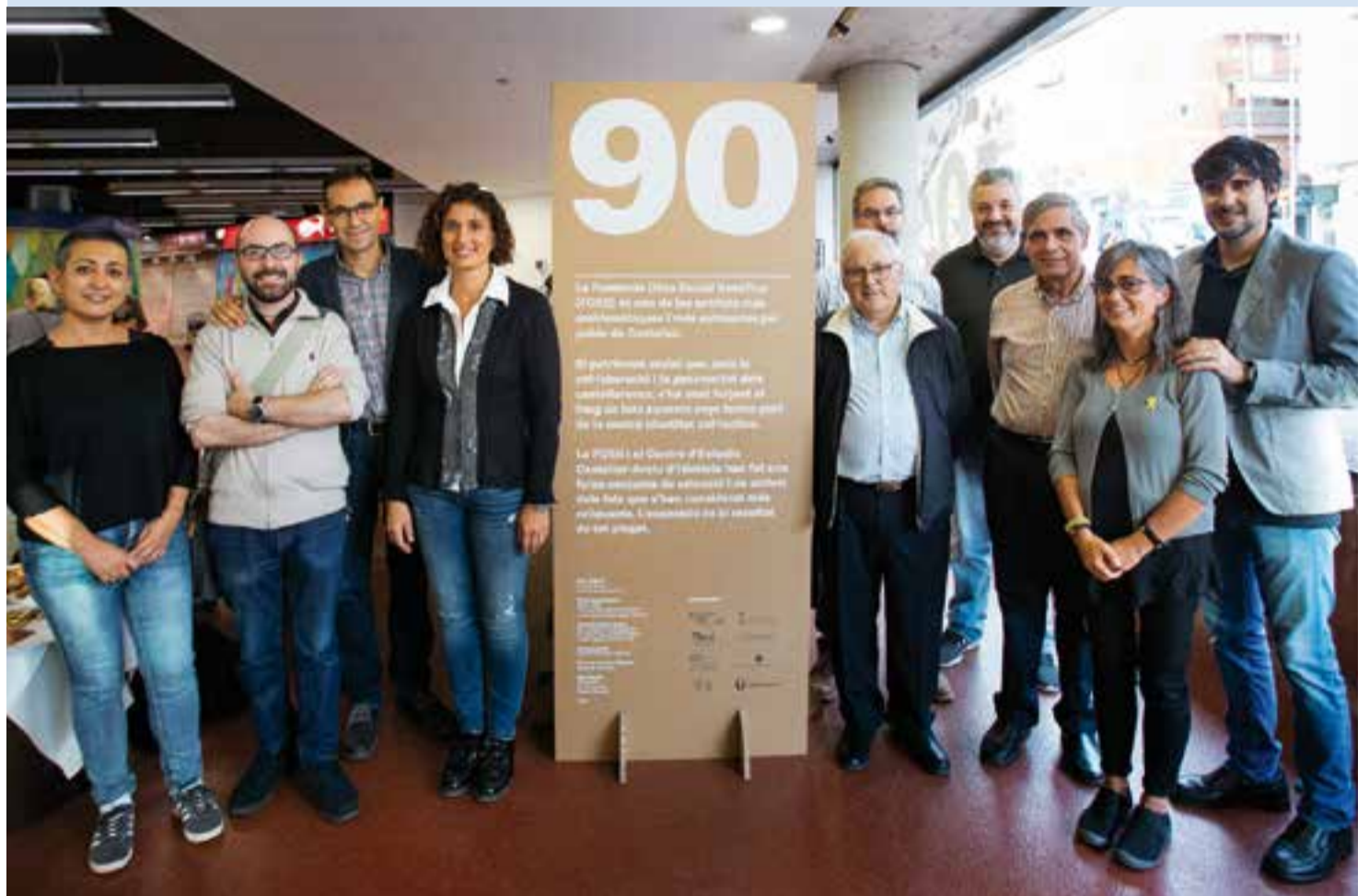
Representants municipals, membres del Patronat de l'Obra Social Benèfica i personal de l'ens en la foto de família durant la inauguració de l'exposició.

Una mostra itinerant que va arrencar al Mercat repassa la seva història