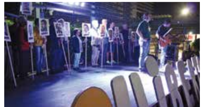
Commemoració del 1r aniversari dels dijous pels presos polítics. || R.G.

D'altra banda, amb la voluntat de "no oblidar" , de "no defallir" , i de "fer-los més presents" , van pujar a l'escenari un castellarenc per cada pres polític i exiliat pel procés sobiranista, amb una fotografia de cadascun d'ells. Finalment, durant l'acte, els assistents van dedicar un minut de silenci al punt de les 8 del vespre a les víctimes de les inundacions a les illes Balears, a Sant Llorenç. Com és habitual, el cant del Segadors va tancar l'acte reivindicatiu. † || R. GÓMEZ