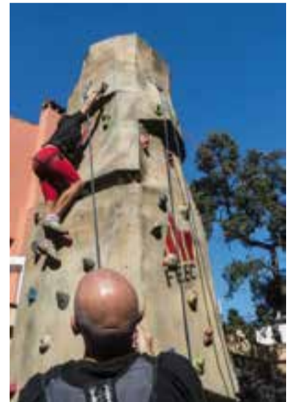
Boulder instal·lat al pati del C.E.C.

Finalment, per donar per acabada la celebració de la Diada del Soci, cap a les 15.30 hores, es farà la tradicional entrega de medalles i plaques als socis que compleixen 25 i 50 anys com a membres de l'entitat. +