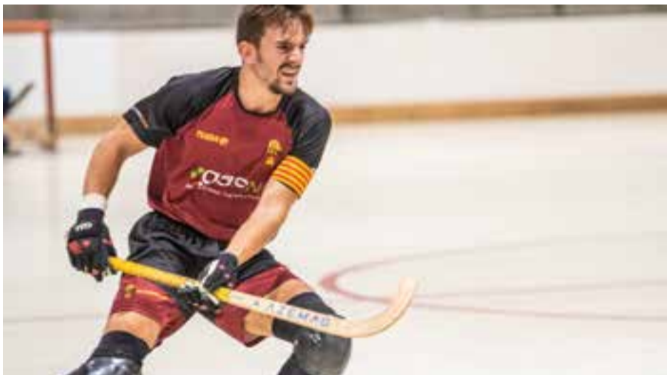
L'HC Castellar encara no coneix la victòria en el que portem de lliga. || A. SAN ANDRÉS

Els grans segueixen sense aixecar cap en una temporada on hauran de lluitar de valent per salvar la categoria i per adaptar-se a l'estil de joc que vol Gassó, guanyant en velocitat de joc -un altre dels punts febles de l'equip- i en consistència. L'equip segueix al fanalet vermell, abans de rebre al CE Arenys de Munt, equip que ocupa la 7a posició amb tres victòries. ▶ || A. SAN ANDRÉS