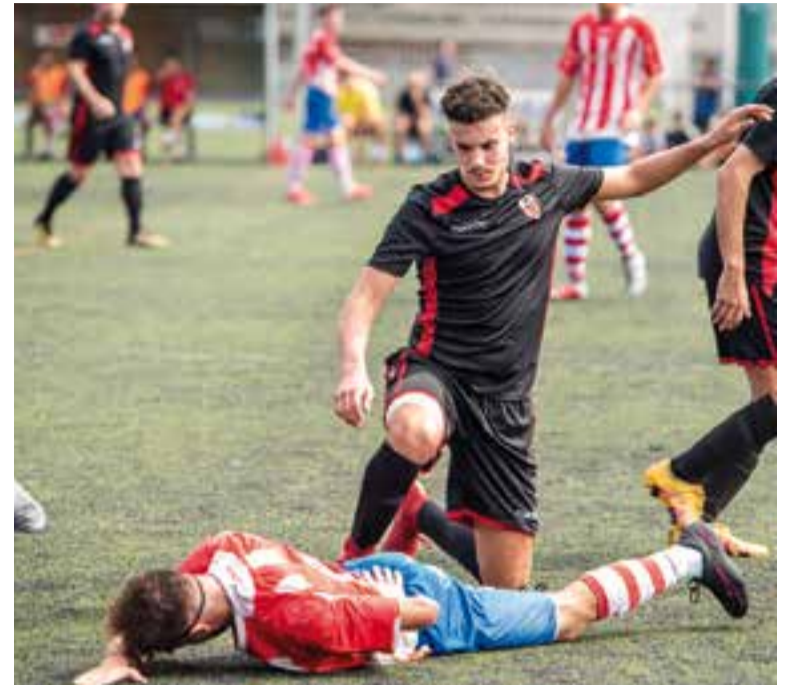
La UE Castellar va caure en picat després del segon gol.