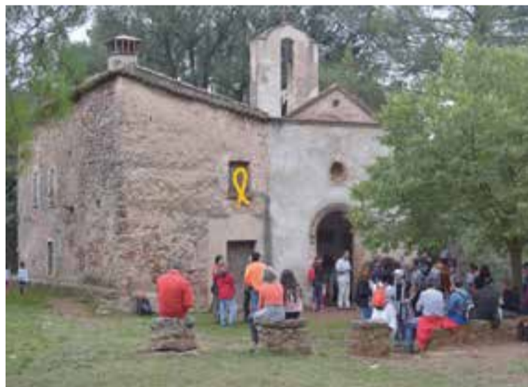
L'escola de música Artcàdia va actuar a la Capella de la Mare de Déu de les Arenes. || G.P.

Tot plegat conforma un farcell d'història que no es pot perdre amb el curs del temps. I això és precisament el que s'ha reivindicat a les Jornades del Patrimoni Europeu d'aquest any, que s'han celebrat durant el cap de setmana a Castellar, gràcies al Centre d'Estudis de Castellar - Arxiu d'Història, l'Ajuntament, l'Associació de Veïns de les Arenes, els Amics de l'Ermita de les Arenes, la Comunitat de les Siervas, l'Escola de Música Artcàdia i