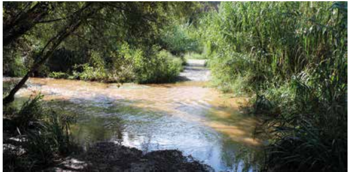
El cabal del riu Ripoll, al costat de Can Barba, en una imatge de dilluns.

L'avaria que va afectar les urbanitzacions de l'Aire-Sol D i El Balcó es va iniciar diumenge a la nit, coincidint amb el temporal d'aigua que va caure al municipi. El servei no s'ha pogut restablir amb normalitat fins avui dimarts, a les 8.30 del matí. +