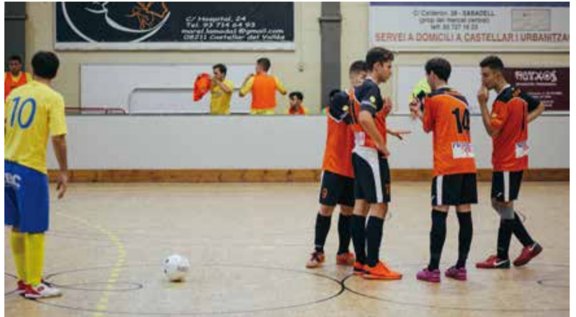
Jugadors de FS Castellar parlen sobre una jugada durant el partit de dissabte passat.

L'equip ocupa la penúltima posició de la taula, abans de rebre al Blume a l'Aleña Club Esportiu de L'Hospitalet, sisè classificat. +