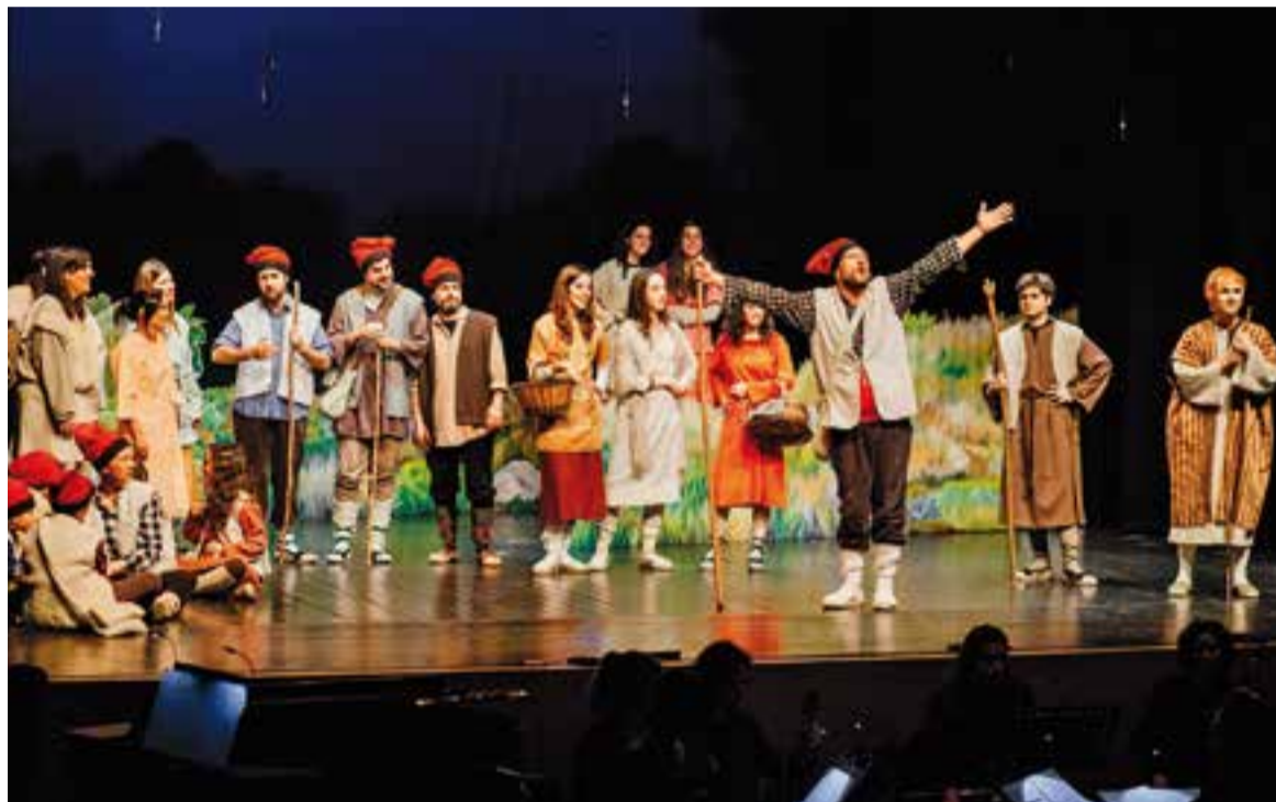
La sarsuela 'Els Pastors Cantaires de Betlem' de Mossèn Joan Abarcat formen part del patrimoni immaterial del Vallès.

Enguany, la trobada es dedica al patrimoni cultural immaterial del Vallès. "Es tractarà d'inventariar quin és el patrimoni immaterial que tenim al Vallès, i definir què és, concretament", segons Vicente. En aquest sentit, actualment, el Vallès es troba immers en el procés de realització de l'Inventari del Patrimoni Cultural Immaterial (PCI) de la comarca, construït per la comunitat. Sobre ell s'edifica el seu sen-