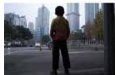
Cal Gorina, CCCV i L'Aula LAST DAYS IN SHIBATI

DocsBarcelona del Mes Dia: divendres 14 de desembre Hora: 21 h Lloc: Auditori Municipal Versió original subtítulada en català