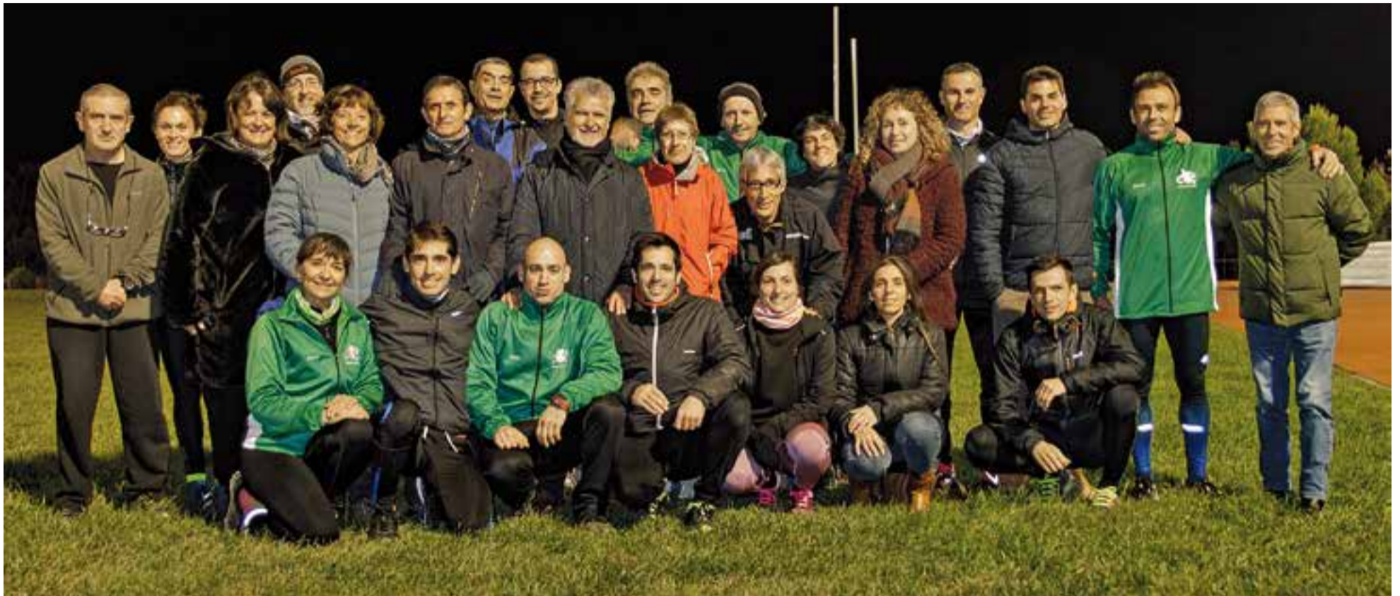
La secció de veterans del Club Atlètic Castellar sempre ha estat una de les que més èxits ha donat al club. A la foto, una part molt significativa dels atletes veterans que han passat i que formen part de l'entitat. || CAC

El Club Atlètic Castellar torna a posar en valor la secció màster amb resultats excel·lents, com en èpoques passades