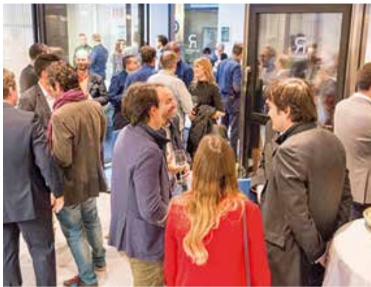
La festa d'inauguració del nou 'showroom' va aplegar uns 60 convidats.

Reynaers Aluminium va traslladar al 2015 les oficines que tenia a Sant Quirze al polígon Can Carner de Castellar. L'empresa va invertir prop de 2 milions d'euros en una instal·lació amb una àrea total de 4.200 m 2 , dels quals 3.000 m 2 són edificats, que acullen les oficines, showroom , servei tècnic, sala de formació i magatzem de perfils i accessoris amb una capacitat global de més de 900 tones. ➔