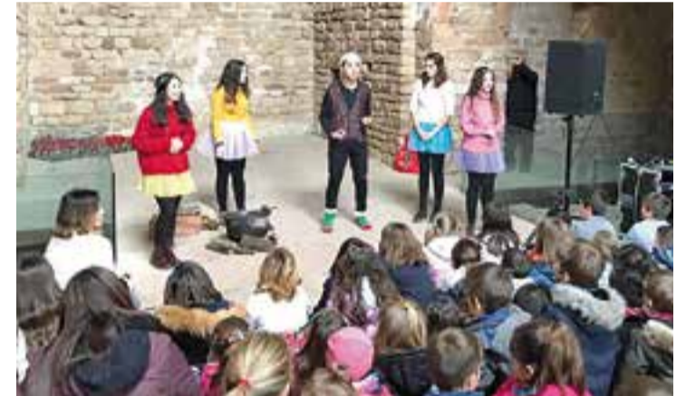
Els infants escolten les històries a l'interior de l'ermita de Castellar Vell.