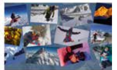
Centre Excursionista de Castellar K2 + BROAD PEAK + MANASLU, 72 DIES AL LÍMIT

+ INFO: www.castellarvalles.cat , www.rubricinemanacastellar.com