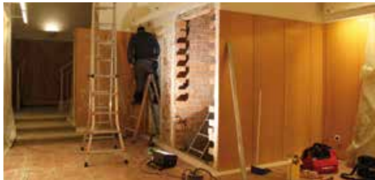
Un operari treballant en l'ascensor al vestíbul de l'Ateneu.

El teatre estrenarà un ascensor al vestíbul i tindrà millores en seguretat