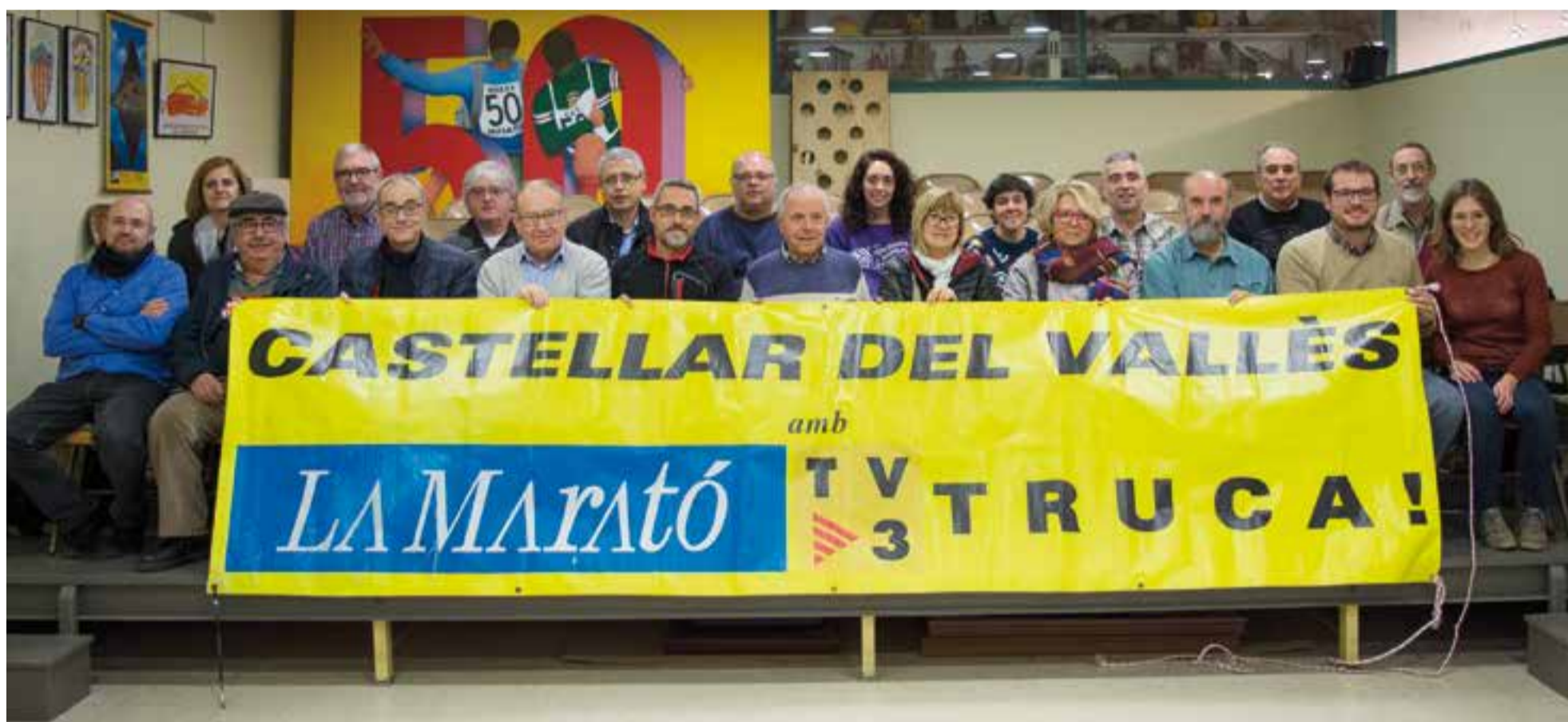
Foto de família dels diversos representants de les entitats i col·lectius castellarencs que donen suport a La Marató a Castellar en una imatge presa a la seu del CEC.