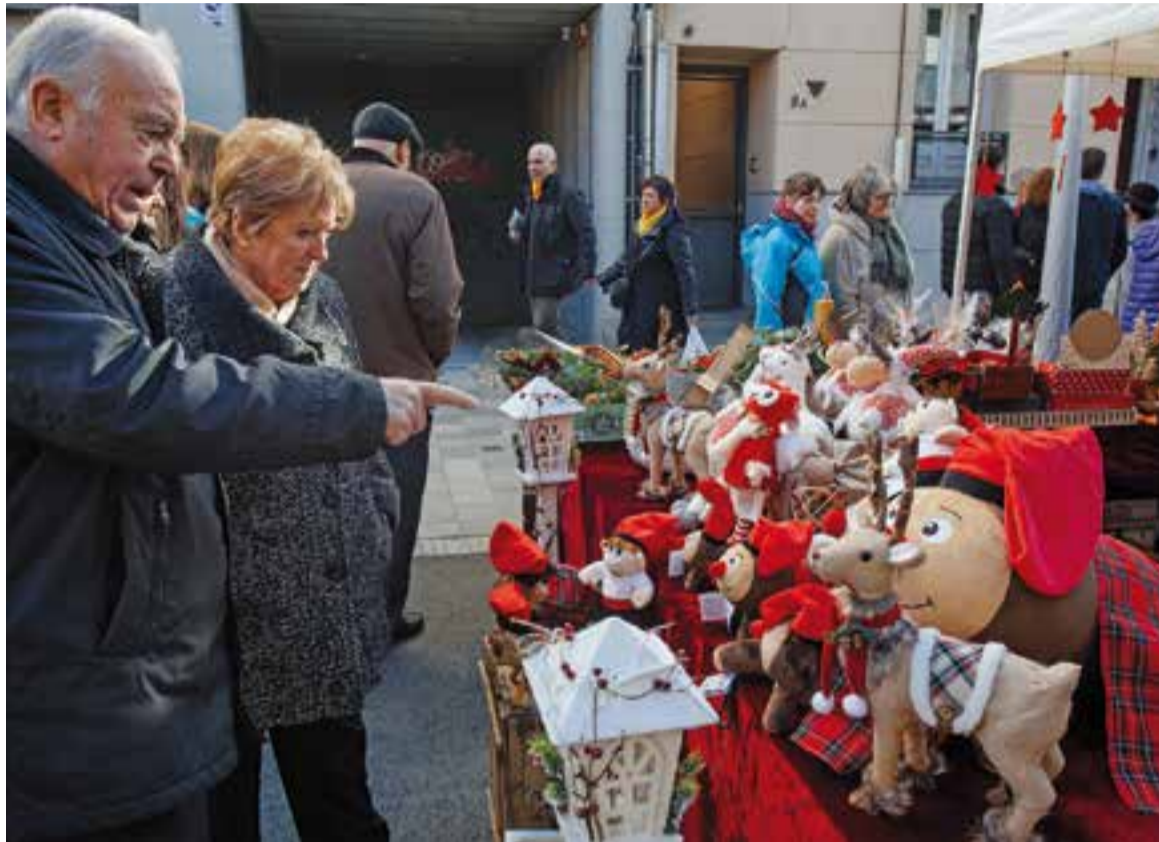
Uns visitants a la Fira de Nadal de l'any passat mirant alguns elements decoratius.

A les 18.30 hores es farà un sorteig presencial de tres patinets elèctrics obsequi de l'Associació de Comerciants de Castellar i d'entrades per l'obra de teatre Les noies de Mossbank Road programat a l'Auditori Municipal el divendres 21 de desembre. Durant tot el dia, els visitants a la fira que comprin a les parades rebran una butlleta que hauran de dipositar a la parada de Comerç Castellar.