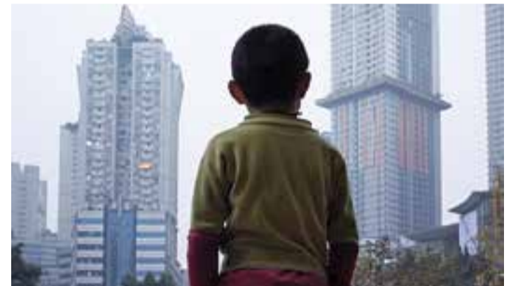
Fotograma de 'Last days in Shibati', el DocsBarcelona de desembre

El director H. Dusollier és llicenciat en Història a la Sorbona i en Belles Arts a París, va realitzar el seu primer documental Obras l'any 2005, una proposta tècnica i artística que va ser seleccionada a Locarno, nominada al premi César, SCAM i que es va convertir en el curtmetratge més premiat de l'any en festivals internacionals. ♦ || M. A.