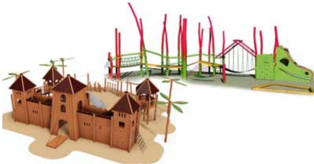
Dos dels elements que tindran els jocs infantils inspirats per la llegenda del drac de Sant Llorenç. || IPLAY URBAN DESIGN

Els infants també comptaran amb un amfiteatre on podran fer representacions davant dels pares i mares, familiars o amics. A més, també s'hi ubicaran pis-