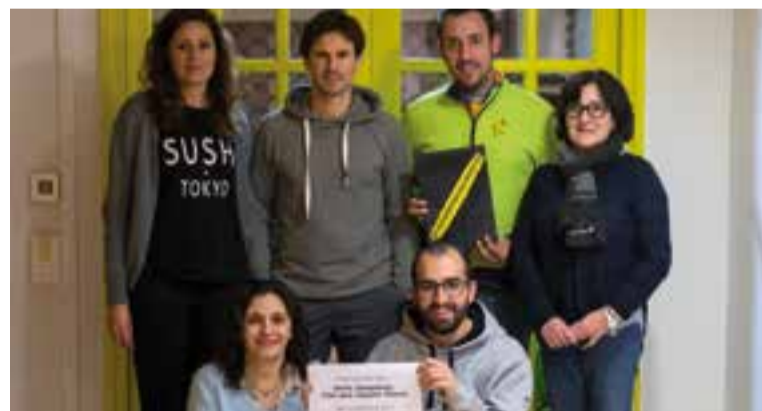
Membres de l'executiva d'ERC i de l'equip que ha elaborat el llibre